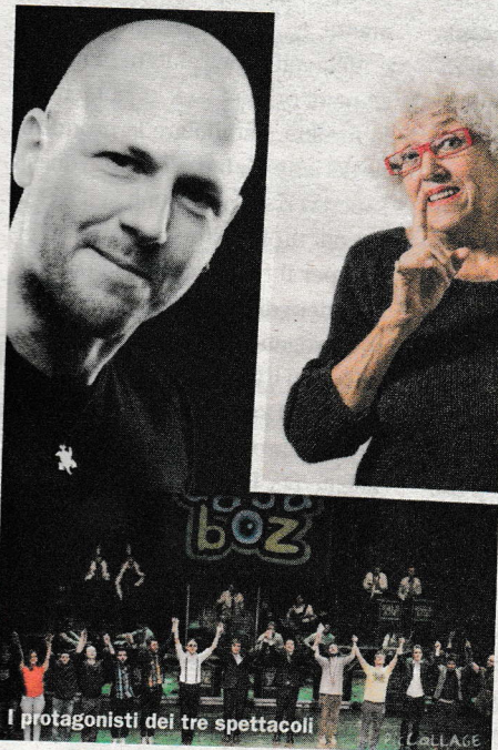
I protagonisti dei tre spettacoli

Previdita biglietti in segreteria del Circolo, venerdì 27 febbraio, martedì 3 e venerdì 6 marzo (ore 17.30 - 18.30, tel. 0472 670017). Spettacolo singolo 12 euro. Pacchetto di tre spettacoli 30 euro.